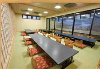
2F 広間【さくら】 最大収容人数 / 48名

バス旅行などの大人数にも対応致します。また、少人数でお越しいただいても、掘りごたつ座敷や小上がり席にて、ごゆっくりお過ごしいただけます。