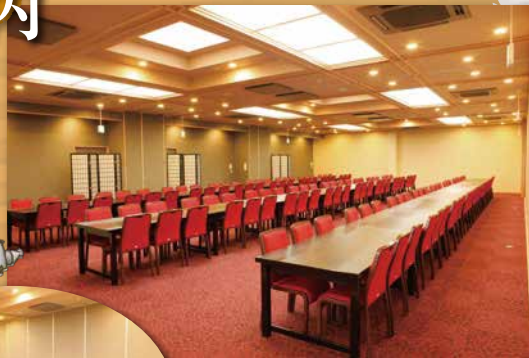
2F 大広間【まつり】 最大収容人数 / 144名