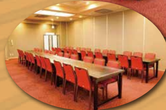
大広間は3分割の小部屋にもなります。 最大収容人数 / 48名

バス旅行などの大人数にも対応致します。また、少人数でお越しいただいても、掘りごたつ座敷や小上がり席にて、ごゆっくりお過ごしいただけます。