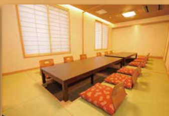
1F 掘りごたつ座敷【七島・八島】 最大収容人数 / 16名(分割可)