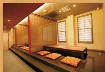
1F 小上がり席 最大収容人数 / 22名