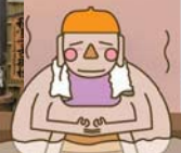
下諏訪温泉源泉を、贅沢にかけ流し。その名湯をゆっくりとご堪能ください。