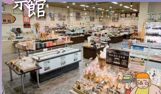
信州ならではの土産を多数ご用意しております。

大切な方々へのお土産に、「信州諏訪ならではの味」をお届けしませんか？ 遠方の方や地元の方々にも大変喜ばれております。